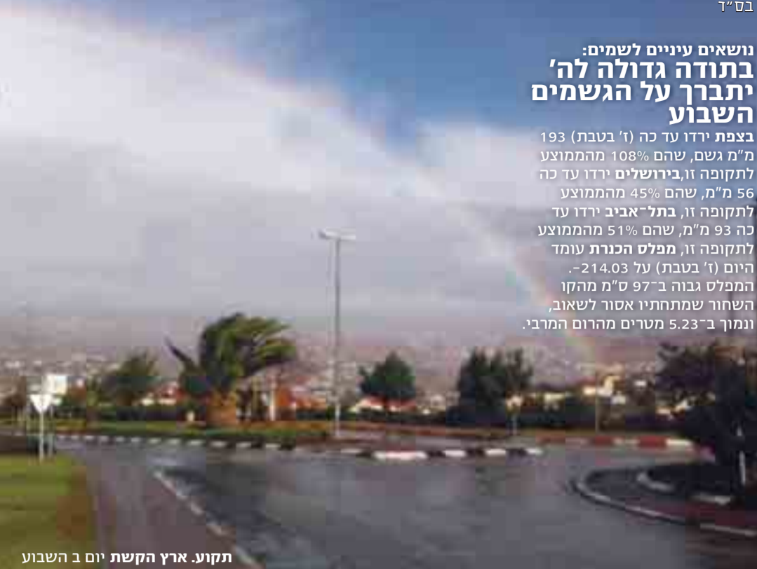
תקוע. ארץ הקשת יום ב השבוע

נושאים עיניים לשמים: בתודה גדולה לה' יתברך על הגשמים השבוע בצפת ירדו עד כה (ז' בטבת) 193 מ"מ גשם, שהם 108% מהמוצע לתקופה זו, בירושלים ירדו עד כה 56 מ"מ, שהם 45% מהמוצע לתקופה זו, בתל-אביב ירדו עד כה 93 מ"מ, שהם 51% מהמוצע לתקופה זו, מפלס הכנרת עומד היום (ז' בטבת) על 214.03- הממלס גבוה ב-97 ס"מ מהקו השחור שמתחתיו אסור לשאוב, ונמוך ב-5.23 מטרים מהרום המרבי.