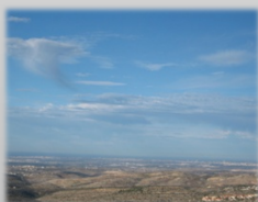
תמונת הכריכה צולמה מהישוב חרישה