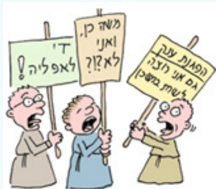
לא בכדי בתכנית לימוד בפרשת קרח, הקריקטורות לבושות בבגדים של כמרים.