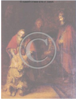
בתכנית הלימוד: הבן האובד - אחד המשלים הידועים בצורות, ומופיע בבשורה בברית החדשה