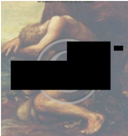
בתכנית הלימוד: אדם וחווה

בתכנית "לב אהרון" הבעייתית 23 . מכון הרטמן נתמך על ידי הקרן החדשה לישראל 24 , תחת הקטגוריה של פלורליזם וסובלנות דתית. המכון משתתף בתכנית למנהיגות נוצרית ומפגש בין דתי 25 .