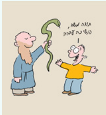
בפרשת חוקת, קריקטורה של משה רבינו, נראה כמו כומר