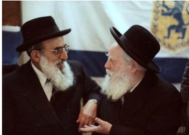
הגרא"א שפירא והגר"ש גורן בעצרת יום ירושלים תשמ"א בישיבת 'מרכז-הרב'

כאשר בתחילת כהונתם של הרב גורן והרב יוסף ברבנות הראשית היו ביניהם חילוקי דעות ומתחים, היה זה הרב שפירא שהשכין שלום ביניהם. בשלהי כהונתם של הרב גורן והרב יוסף כרבנים הראשיים, אף התגייס הרב שפירא לניסיונות לסייע בהארכת כהונתם. לאחר שניסיונו זה לא צלח, היה זה הפעם הרב גורן שהתגייס למען בחירתו של הרב שפירא. במהלך השנים היו ביניהם גם חילוקי דעות 22 , אך מעולם לא היו ביניהם חילוקי לבבות.