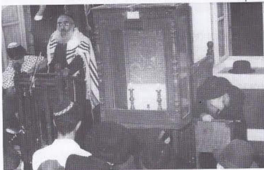
הרב צבי יהודה שומד בשעה שהרב הראשי לישראל הגאון הרב גורן מדבר, כבית הרב