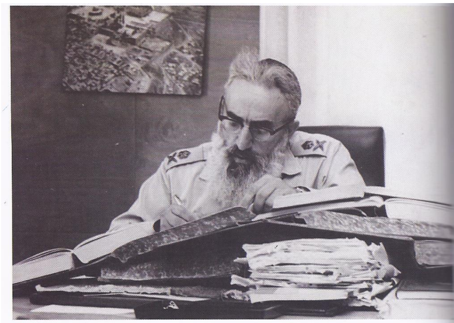
מקור: בעוז ובתעצומות, אבי רט (עורך) ידיעות ספרים, תשע"ד.