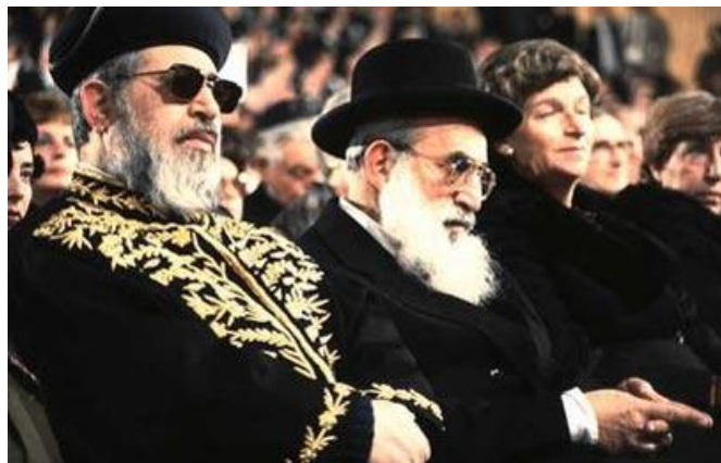
בפתיחת הקונגרס הציוני היהודי ה-30, תשמ"ב