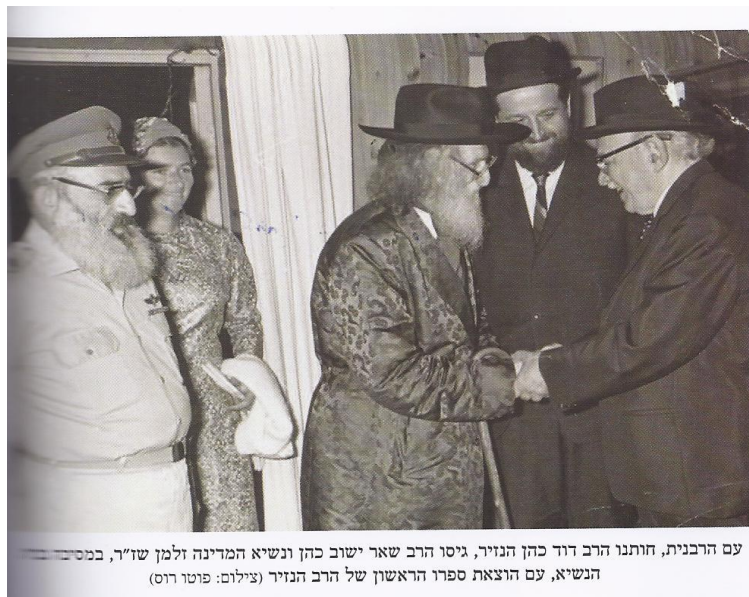
עם הרבנית, חותנו הרב דוד כהן הנזיר, גיסו הרב שאר ישוב כהן ונשיא המדינה זלמן שז"ר, במסיבת הנשיא, עם הוצאת ספרו הראשון של הרב הנזיר

הזוהר הקדוש אומר, שישנם שני סוגי אהבה, אהבה עילאה ואהבה תתאה. ושאלתי פעם, מה ההבדל ביניהן, כלומר איך אנחנו יכולים להבדיל בין אהבה עליונה טהורה לבין אהבה תתאה פשוטה. ואמרתי, שההבחנה ביניהן היא, כשאדם אוהב את משהו או את מישהו ורוצה לבטל את המשהו או המישהו אליו, מעין אהבה גשמית שמטרתה השגת ההנאה העצמית מן האובייקט הנאהב, זוהי אהבה תתאה והיא פסולה. אבל כאשר אדם אוהב את משהו והוא מוכן לבטל את עצמו לשני, או אפילו להקריב את עצמו למען השני, זוהי אהבה עילאה. ומורי חמי הגאון הצדיק (שליט"א) זצ"ל זכה לאהבה עילאה ביחסו ל"רואה" הגדול הרב קוק זצ"ל. הרב ר' דוד ביטל את כל ישותו, זמנו, כוחו ואוצו באהבתו את מרן הרב קוק זצ"ל. חששתי שזוהרו יועם באור הגדול של הרואה הרב קוק זצ"ל. הנה זכינו לראות את האור העצמי הגדול הבוקע ועולה מאורח חייו בקודש מדיבורו וממחשבתו, מביתו ומפרי-עמלו של המחבר הגדול של "קול הנבואה" (שבחי קול הנבואה, קול הנבואה).