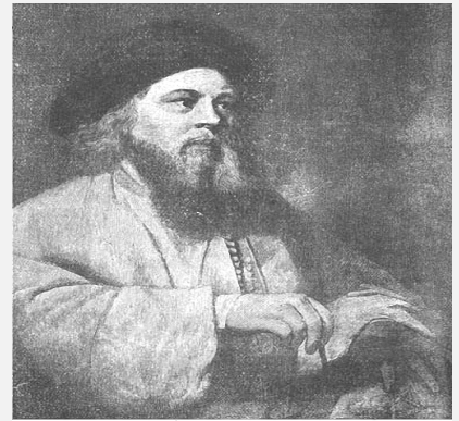
הרב הראשון שיהיה ארץ ישראל

רבי ישראל בעל שם טוב זצ"ל הידוע כ-"אור שבעת הימים": נולד ב- י"ח אלול ה'תנ"ח (1698). התייתם מהוריו בגיל צעיר. שימש כעוזר למלמדי תינוקות וכשוחט. עבד התבודד שנים אחדות בהרים שבין קיטוב לקוסוב. עד גיל 36 הסתיר את מעשיו ועשה עצמו עם הארץ. לאחר מכן התגורר בטלוסט ומז'בוז'.