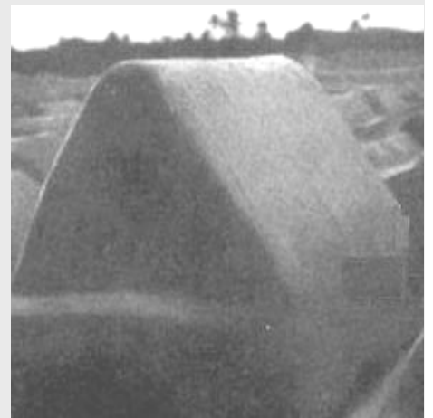
בבבל לא מצוים אבנים, ולכן המצבות כמו הבתים בנויים מטיט ומחמר קשיח