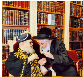
בתמונה: רב מרום הגליל עם מן הרב עובדיה יוסף

"השנית, זו שבעטיו של רשב"י נתגלו סודות התורה בספרו ספר הזוהר, ונפש היהודי הגבוהה צמאה לנסתרות, והוא גם מקור השועות".