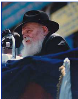
"הרבי של דורנו היה אנטי-ציוני מובהק". הרבי מליובאוויטש זצ"ל. ויקיפדיה.

"צריך להבין את הדברים כפשוטם: היום ישנם סיבות אחרות שנמנעים בעילתם ללכת לצבא - שאנשים מתקלקלים שם וכדומה, אך בעיקרון, הרבי ראה זאת כחובה: אנשים מחזקים את העם היושב בציון כדי שיהודים לא ייהרגו. לא מדובר כאן ביציגנות' כלל. המדינה קיימת וזו עובדה. הרבי קבע פעם: אנחנו מכירים במדינה דה-פקטו ולא דה-יורה. אי אפשר להכחיש את מציאות קיומה של המדינה. זו מציאות כואבת - אבל זה מה שיש. אנחנו לא בעדה. אך אנחנו גם בעד המשך קיום יהודים בארץ ישראל לכל יעשקונו פורעים ערבים. בני ישיבה לא ינטשו את הישיבה. אבל אדם רגיל, זה משהו אחר. הרי גם בעת מלחמת השחרור, אפילו רב העדה החרדית' רבי יוסף צבי דושינסקי, עודד את ההליכה לצבא כדי להגן פיזית על העם".