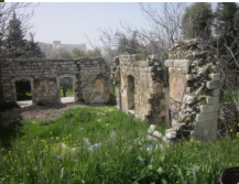
מקום קברה של אמתלאי בת קרנבו

לא עבר זמן רב מאז חשיפת מקום קבורתה הקדום, וכבר המונים עולים להשתטח באחרונה על קברה של אמתלאי בת קרנבו, אמו של אברהם אבינו ע"ה, הממוקם לא-הרחק מצינור של התנא האלוף שמעון הצדיק.