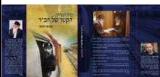
"מיינדנצ'יק - הקטר של חב"ד". כריכת הספר.

יובהר: לא מדובר בעוד קטר רכבת, או בעוד אחד ששימש יו"ר ועד כפר חב"ד. מדובר באגדה ששבתה את קסמם של רבבות יהודים - דתיים ואנטי-דתיים כאחד. "הרב מיינדנצ'יק ראה ביהודי, דבר קדוש", הסביר השבוע אחד הנוכחים בטקס השקת הספר, שנערך במתחם התחנה בתל-אביב.