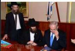
"ראשי ממשלות נועצו בו". ראש הממשלה ביבי נתניהו מצייץ בספר החדש.