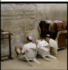
"זה לא ירושלים האמיתית". יהודים מתאבלים בכותל המערבי.

"מי שחתם שזה יהיה, הם הנציגים החרדים", מוסיף הרב גליס בקול זועם. "הם לא יוכלו להתחמק ולומר לנו לא שייכים לסיפור הזה. הם שותפים מלאים למיצג".