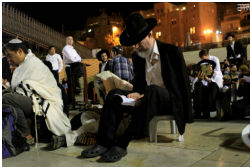
הכותל המערבי, ליל ט' באב שנה שעברה.

"על זה היה דווה ליבנו על אלה חשכו עינינו. על הר ציון ששמש, שועלים הילכו בו" שני היבטים משתרגים נשנו כאן: הלב הדווי ועצוב, והעיניים החשכות. הר ציון ששמש, והשועלים שמהלכים בו. דומה כי הדברים משלימים זה את זה: הלב אפוף עיצבון לנוכח השממה והאין הגדול שבהר הציון - הר המקדש. האין הגדול זועק זעקה אילמת. בנוסף לכך, העיניים חשכות, מביטות במחזה אקטיבי מזוויע: לא זו בלבד שההר שמש ומשרה אווירה מדכאת, גם שועלים מהלכים בו, כאילו זהו עוד חלקת הר קלאסית ומשמימה. כאן, העצב כבר מחלחל, צורב. גדול כפליים. (תשעה באב תשע"ב)