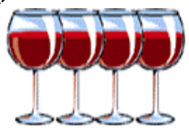
מפסידין: 'וערב' (מלאכי ג')

שנה עשרים ואחת - עלון מס' 1052 @ בשבת אין אומרים "צדקתך". @ במוסף של החג אומרים "מוריד הטל". @ במוצאי החג מתחילים "ספירת העומר". @ במוצאי שבת סוף זמן "ברכת הלבנה" כל הלילה.