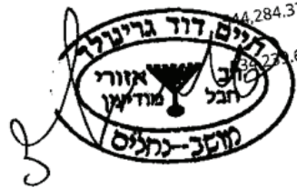
הרב חיים דוד גרינולד רב אזורי חבל מודיעין ורב המושב נחלים