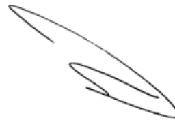
הרב שמחה שטטנר נשיא מוסדות מגדל העמק ונשיא ישיבת חומש