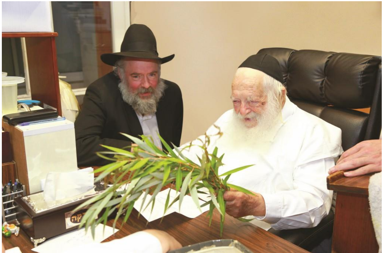
כו אלול תשע"ה שמחת המצוה על פניו !!!

מהדר בערבות הגדלים על הנחל הביאו לפני רבינו ערבות הגדלים על הנחל ממש – ולאחר שבחן מרן את הערבות והתעניין על שלבי גידולם הוא הביע קורת רוח רבה מהעובדה כי לאחר שנים רבות ניתן יהיה להשיג ערבות הגדלות על גבי נחל ממש ואמר כששביעות רצון על פניו, "סאיז שיינע ערבות" וביקש להשתמש אף הוא בערבות אלו בחג הסוכות. מרן הגר"ח קניבסקי הרחיב בדבריו על עיקרי הפוסקים במעלת ערבות הנחל ואמר כי "ראוי למי שיכול להדר בערבות נחל אלו למצוות ד' מינים.