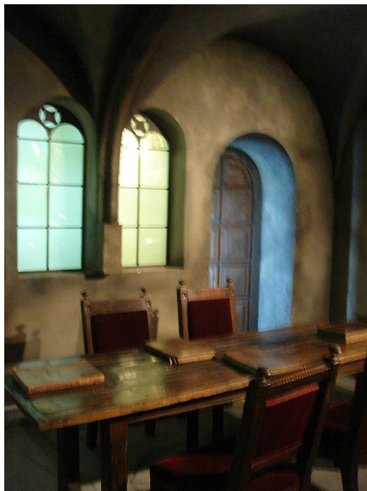
דגם בית מדרשו של רש"י בצרפת

עמד מרן הסטייפלער והתפלא: וכי שורת הדין היא, שדוקא הללו אשר נפשם חשקה בתורה עד שעה ששית, יהיו נדונים ברותחין, במארה? וכי לא נמצא דמי שהקדים לצאת, הוא נשכר בזה שנפטר מקפידה יתירה כזו?