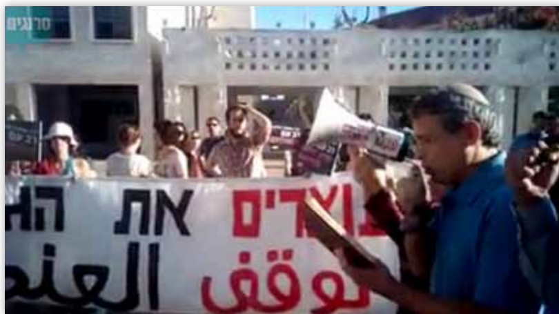
בתמונה: אנשי 'תג מאיר' מפגינים בירושלים נגד מינוי הרב אליהו לרב הראשי של העיר

3. פעילי 'המרכז הרפורמי לדת ומדינה' ו'תג מאיר' הפגינו נגד מינוי הרב שמואל אליהו לרבה הראשי של ירושלים, תוך נשיאת כרזות "עוצרים את הגזענות" ו"גזענות ושנאה- לא תורה שלי". (אוקטובר 2014) 62