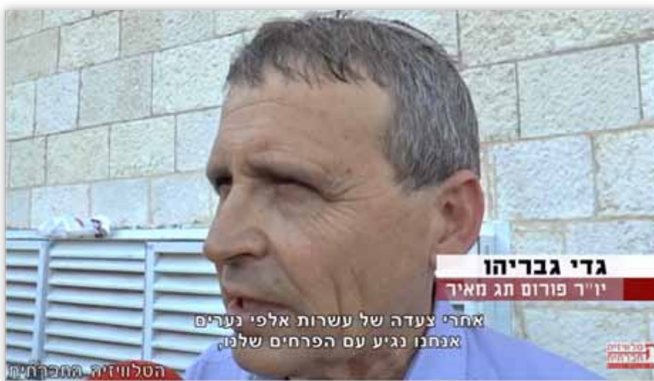
בתמונה: יו"ר 'תג מאיר' מציג את הפעילות להזדהות עם ערביי ירושלים נגד הצעדה (2016) 92

כחלק מהצגת ריקוד הדגלים כאירוע גזעני ופסול, ארגן 'תג מאיר', מארגוני הקרן שהוקם כדי לפעול נגד אירועי "תג מחיר", פעילות לחלוקת פרחים לערביי ירושלים. הפעילות מתקיימת מזה כמה שנים. בפעילות זו הביעו בארגון הזדהות עם ערביי העיר כנגד האירוע המציין את איחוד ירושלים.