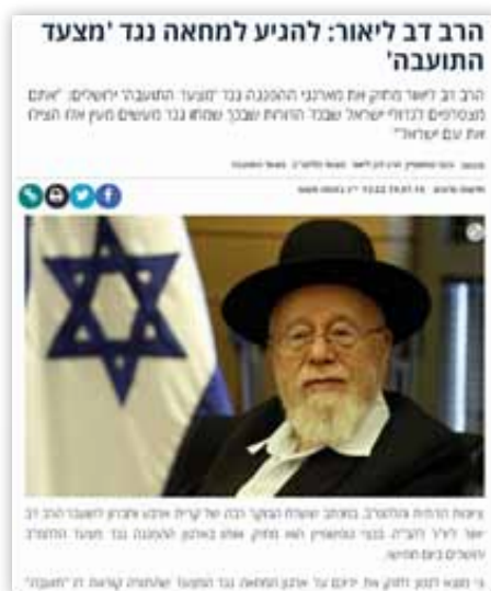
בתמונה: הפרסום המקורי ב'סרוגים' 66

ישראל חופשית' פרסם פוסט הכפשה נגד הרב דב ליאור. במסגרת הפוסט פרסם הארגון כתבה מתוך אתר 'סרוגים'. הפוסט מטעה את הקוראים לחשוב כי התוכן המופיע בעמודה מימין (בצבעי שחור-אדום) נכתב במקור במסגרת הכתבה ב'סרוגים', בעוד שבפועל מדובר בהוספה של 'ישראל חופשית'. להלן התמונות.