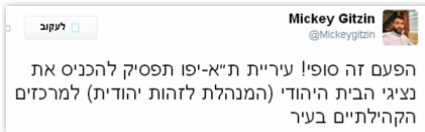
בתמונה: גיצין מתגאה בסילוק 'המנהלת' מת"א 48

בתקופה בה הוא כיהן כחבר עיריית ת"א-יפו מטעם 'מרצ', הוביל מיקי גיצין את סילוק תהליך הוצאת 'המנהלת לזהות יהודית' מפעילותה בת"א. 46 לאחר הוצאתה, פרסם גיצין את הדברים הבאים: "אני שמח שבתל אביב-יפו הצלחנו לבלום את התופעה, אבל עכשיו יש צורך להמשיך ולפעול באופן אינטנסיבי גם במערכת החינוך הפורמלי וגם בערים נוספות". 47 (נובמבר 2016)